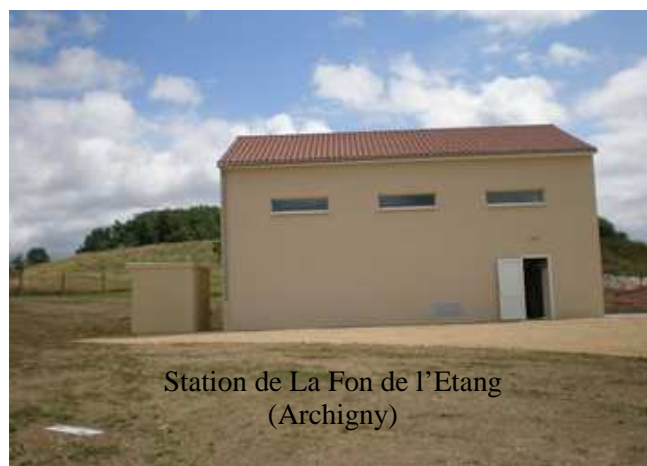
Station de La Fon de l'Etang (Archigny)

La procédure est terminée pour les captages de Fon de l'étang F1 et F2 ainsi que la Bouffonnerie ; elle est à compléter pour le forage F3 de La Fon de l'étang.